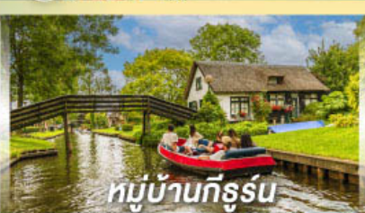
หมู่บ้านทีร์รูน