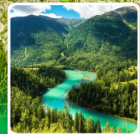
ทะเลสาบคานาสือ