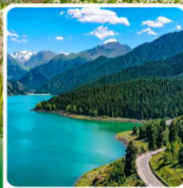
อุทยานเทียนซาน เทียนฉือ