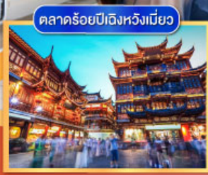
ตลาดร้อยปีเมืองหวงเหมียว