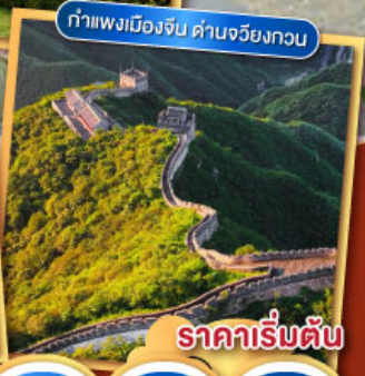
กำแพงเมืองจีน ด้านจวิ๋นกงวน