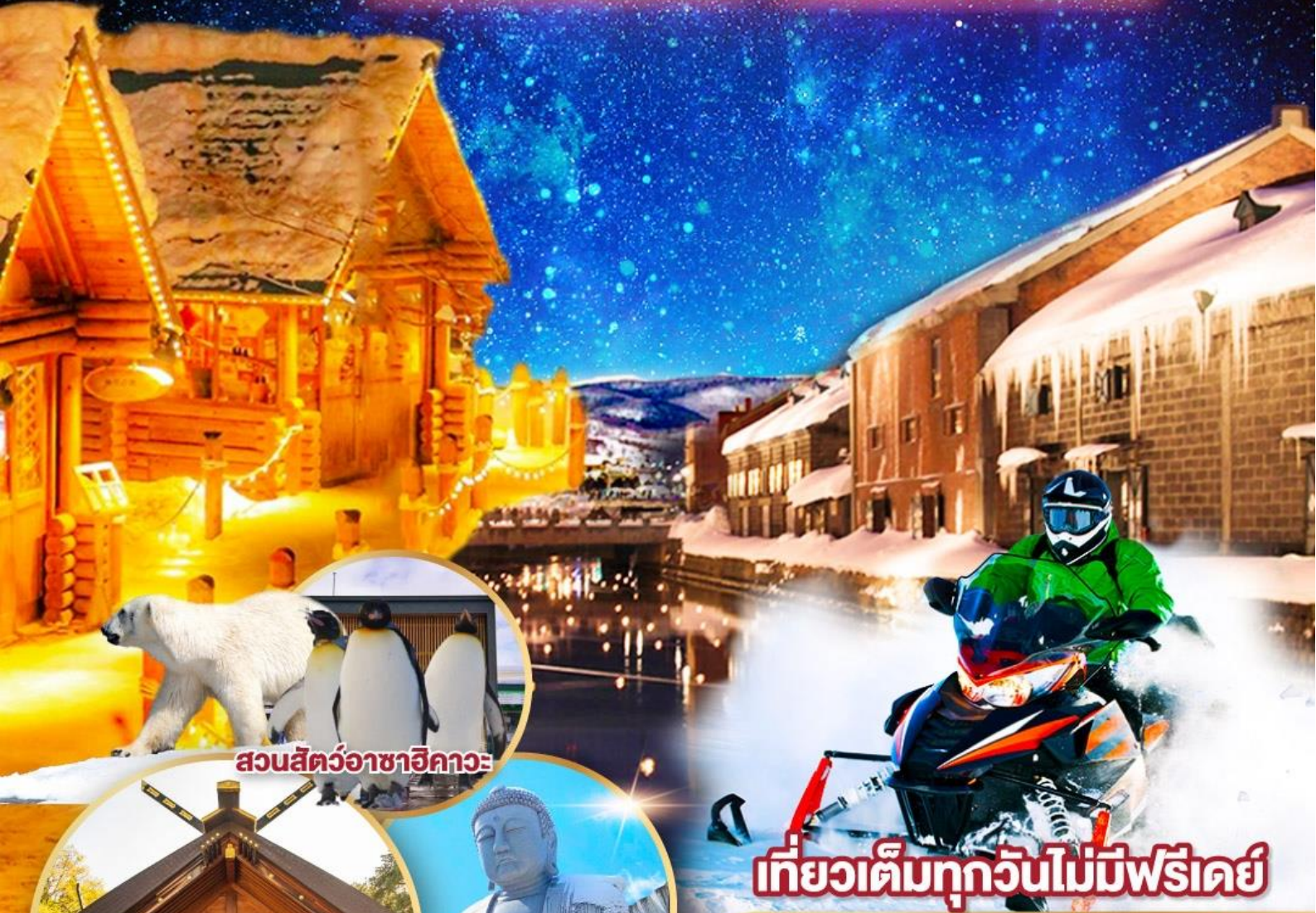
สวนสัตว์อาซาฮิกาวะ

พักโรงแรมในชิปโปโร 2 คืน เต็มอิ่มกับกิจกรรมลานสกี