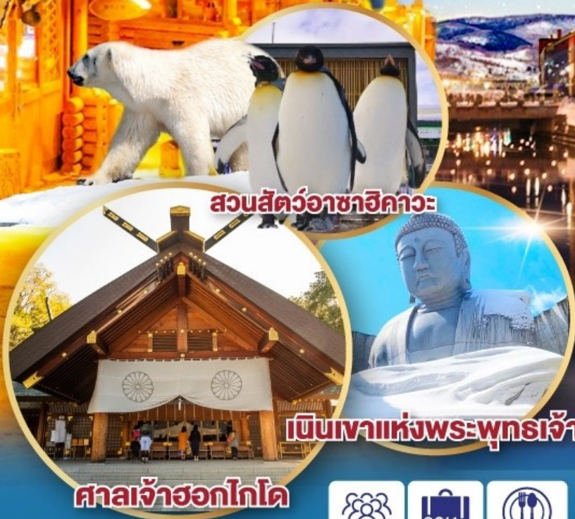
สวนสัตว์อาซาฮิกาวะ