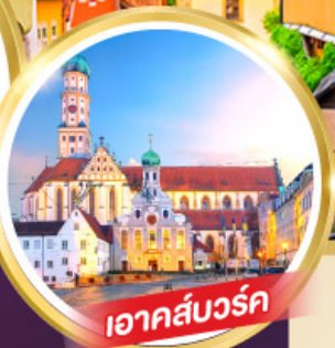
เอาคส์บวร์ค