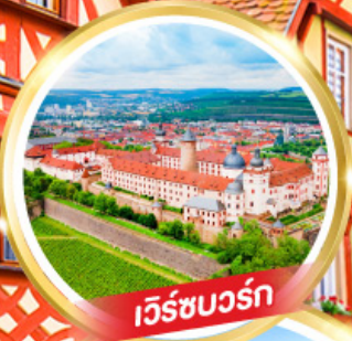
เว็ร์ซบวร์ก