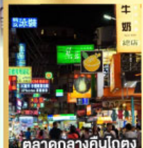
ตลาดกลางคืนโตง