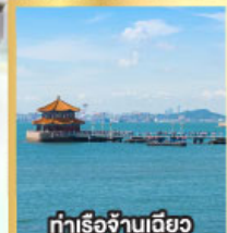
ทำเรือจั้นเฉียว