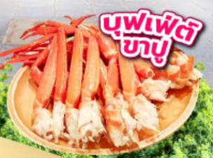
มิตซูเอะอิเกะอิชิอิชิ พาร์ค คิซึระซึ