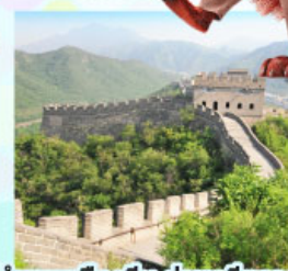
กำแพงเมืองจีนด่านจวิ๊ยงทว