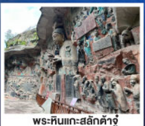
พระหินแกะสลักตัวจู้