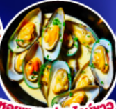
หอยแมลงภู่ออนันท์