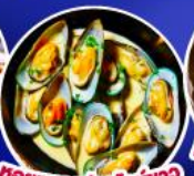
หอยแมลงภู่นิวอิงา