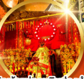
วัดเจ้าแม่กวนอิมฮองฮำ (สวนหนานเหลียน)