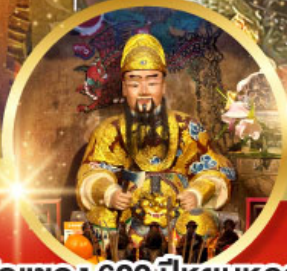
วัดแซกง 600 ปี หุ่นทอง