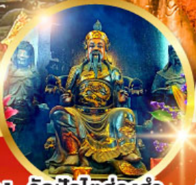
วัดปิกโตฮองฮำ