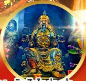
วัดปักไต้ฮ้องอำ