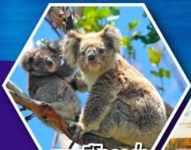
ชมหมีโคอาล่า ณ สวนสัตว์ซิดนีย์