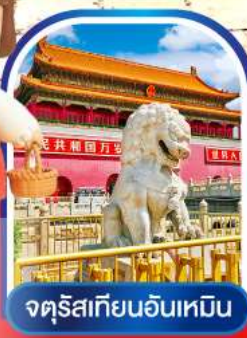
จตุรัสเทียนอันเหมิน