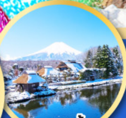
หมู่บ้านน้ำใส ไอชิโนะอัททัง