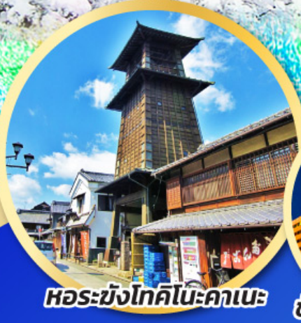
หอรบั้งโทคิโนะคาเนะ