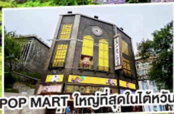
POP MART ใหญ่ที่สุดในไต้หวัน