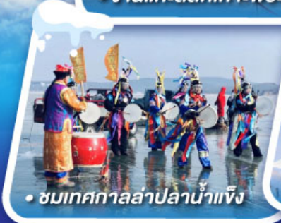
• ชมเทศกาลล่าปลาน้ำแข็ง

งานเทศกาลแกะสลักหิมะที่ใหญ่ที่สุดในโลก HARBIN ICE & SNOW FESTIVAL 2025 เที่ยวหมู่บ้านหิมะ ดินแดนหิมะอันสุดประทับใจ