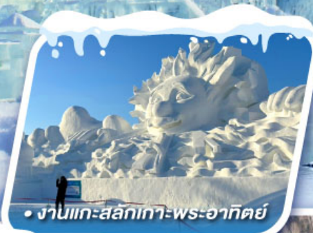
• งานแกะสลักเทวพระอาทิตย์

ชมดอกเกล็ดหิมะ อู๋ซัง ทัศนียภาพอัศจรรย์แห่งทะเลสาบกระจก จิ้งป้อหู