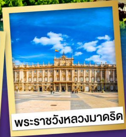
พระราชวังหลวงมาดริด