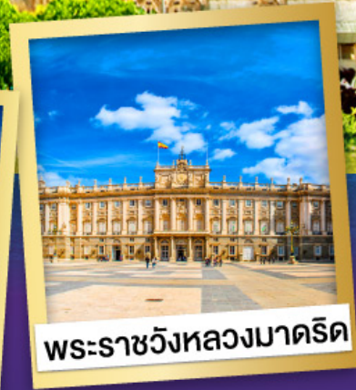
พระราชวังหลวงมาดริด