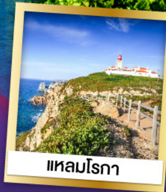
แหลมโรกา