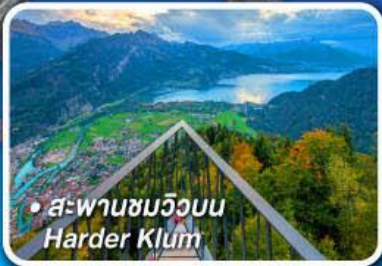
• สะพานชมวิวนบน Harder Klum