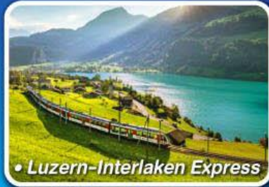
• Luzern-Interlaken Express