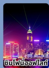
ชมไฟนีออนฟลอร์ท

ราคาเที่ยวเที่ยวเกินคุ้ม 12,999 บาท/ท่าน