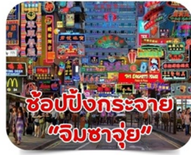
ช้อปปิ้งกระจาย "จิมซาจุ่ย"