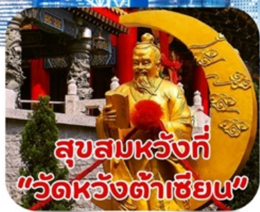
สุขสมหวังที่ "วัดหวังต้าเซียน"

แพ็คเกจทัวร์ฮ่องกง 3 วัน 2 คืน ที่คุ้มค่าที่สุดสุดในสามโลก