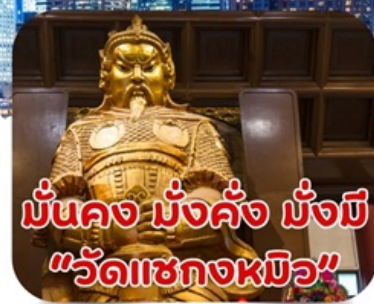
มันคง มั่งคั่ง มั่งมี "วัดเซกวงหมิว"