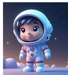
รูปตัวอย่าง