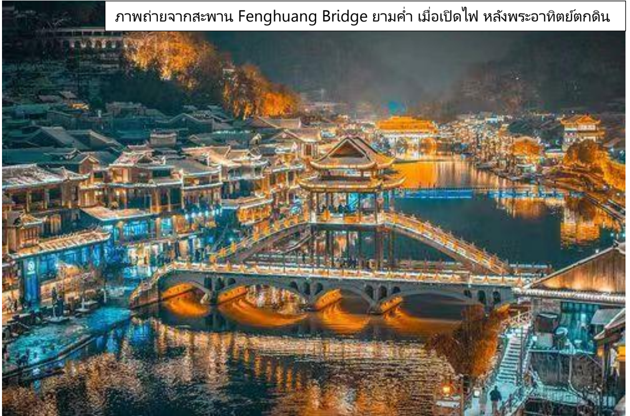
ภาพถ่ายจากสะพาน Fenghuang Bridge ยามค่ำ เมื่อเปิดไฟ หลังพระอาทิตย์ตกดิน

ได้เวลานัดหมาย นำท่านเดินทางไปพักที่จีโซว เมืองไคล์เคียง เพื่อเตียงที่นุ่มกว่า และรับประทานอาหารเช้าแบบ INTERNATIONAL BUFFET