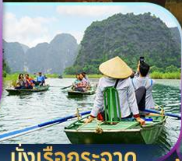
นั่งเรือกระจาด