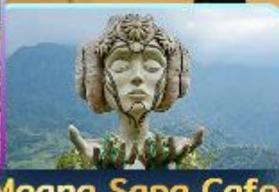
Moana Sapa Cafe