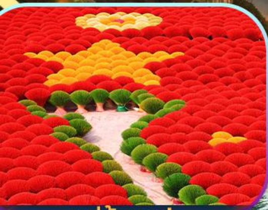
หมู่บ้านรูป