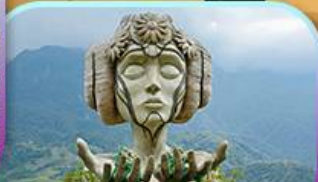
Moana Sapa Cafe