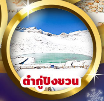
ต่ากู่ปิงชว่น