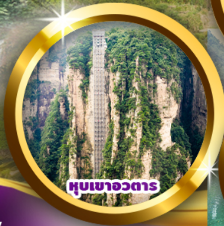
หุบเขาวงตार