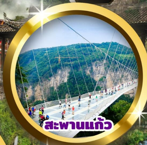
สะพานแก้ว