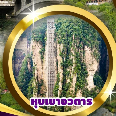
หุบเขาวตาร