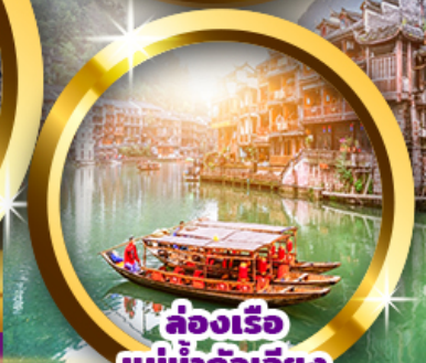
ล่องเรือ แม่น้ำถั่วเจี๋ย