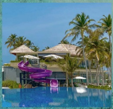
Main Pool with Slider