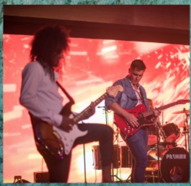
Hard Rock Cafe