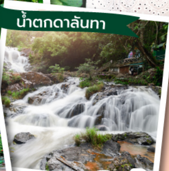
น้ำตกดาลันทา