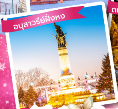
อนุสาวรีย์พิงทง