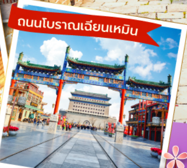
ถนนโบราณเฉียนเหมิน