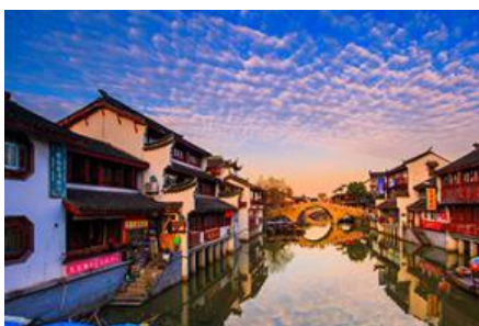
เมืองโบราณ ซิเป่า

ค่ำ รับประทานอาหารค่ำ ณ ภัตตาคาร พักที่ โรงแรม Luna Garden Hotel or Holiday Inn Express Hotel 4* หรือเทียบเท่าในเมืองเชียงใหม่