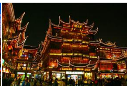
ย่านฉางหวงเมี่ยว