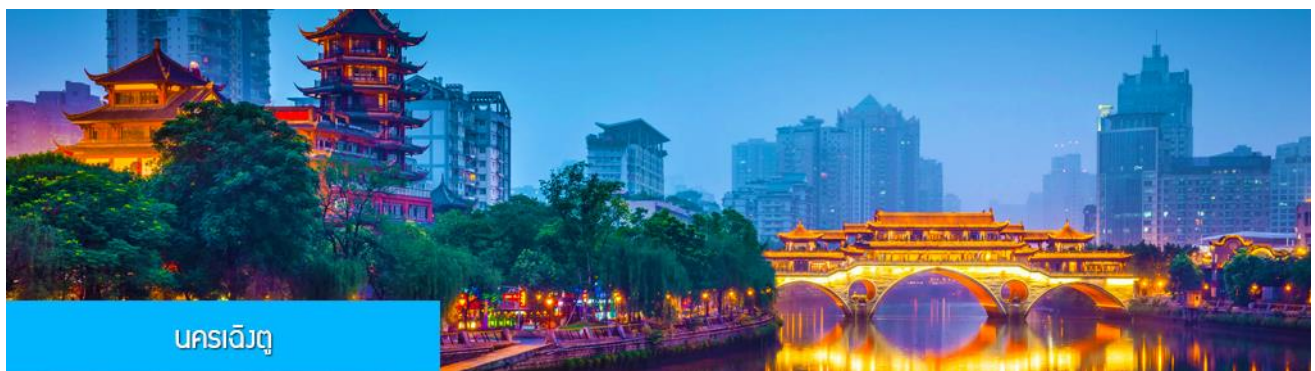
นครเป่ย์จิง