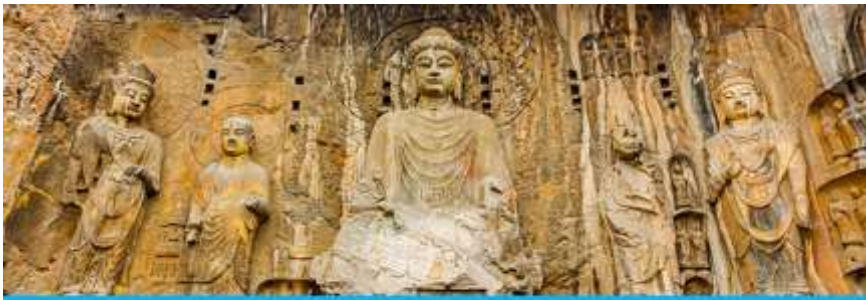
ถ้ำหินหลงเหมิน