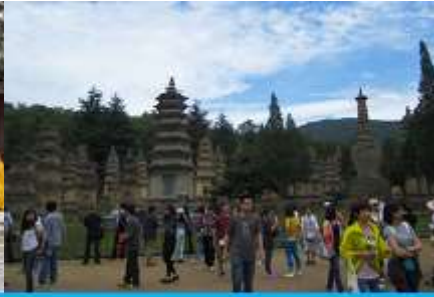
ป่าเจดีย์