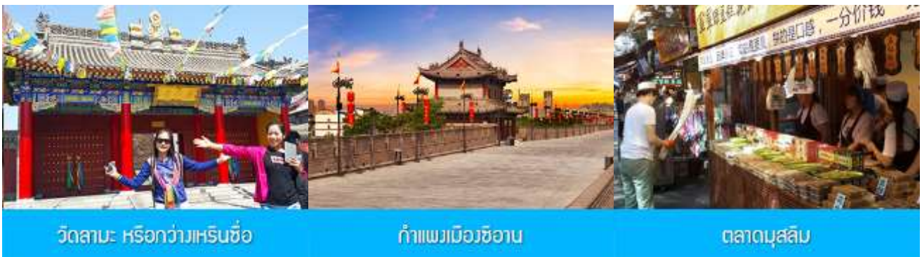
วัดลามะ หรือกว้างเหรินชื่อ

พักที่ TITAN CENTRAL PARK HOTEL 4* หรือ โรงแรมในระดับเดียวกัน เมืองซีอาน