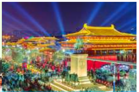
Nightless City of Great Tang