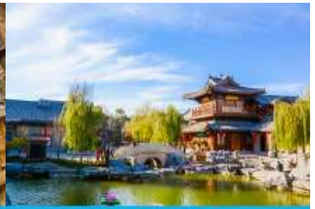
เมืองโบราณลั่วหยี่