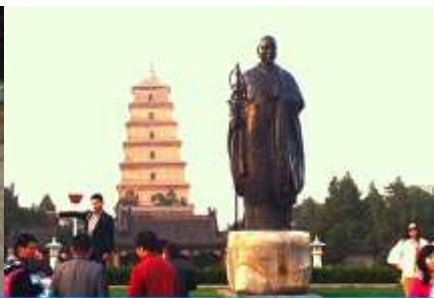
เจดีย์ห่านป่าใหญ่