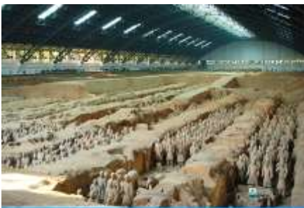
สุสานกอภัพทหารม้าจีนซี

ค่ำ รับประทานอาหารค่ำ ณ ภัตตาคาร พักที่ XINYUAN HOTEL 4* หรือ โรงแรมในระดับเดียวกัน เมืองหั่วซ่าน