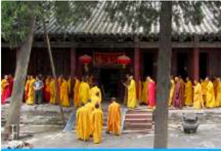
วัดเส้าหลิน