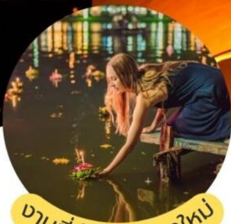
ขานฮ่เป็ง จ.เซียงใหม่