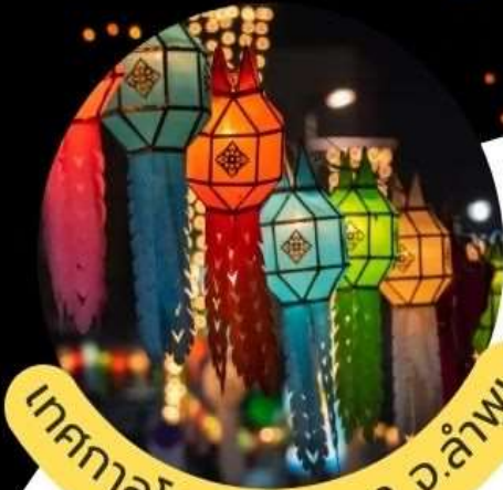
เทศกาลโคมแสนดวง จ.ลำพูน