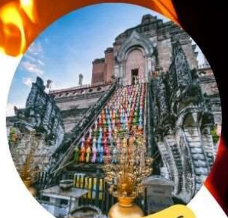
ไหว้พระขอพร