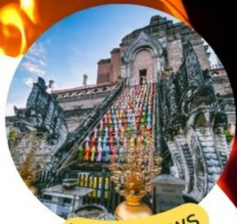
ไหว้พระะขอพ