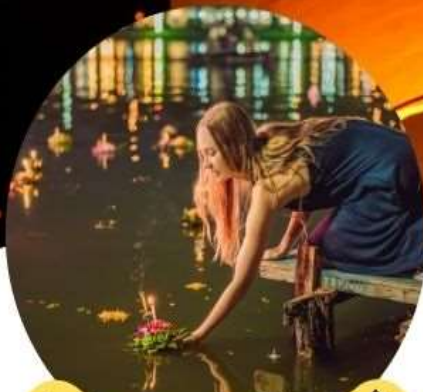
งานยี่เป็ง จ.เชียงใหม่