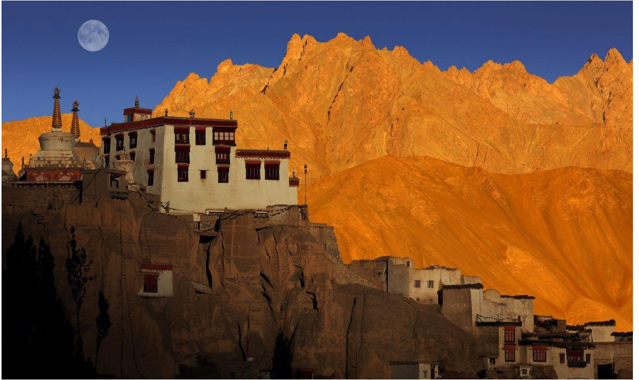
12.00 น. รับประทานอาหารกลางวัน(6)