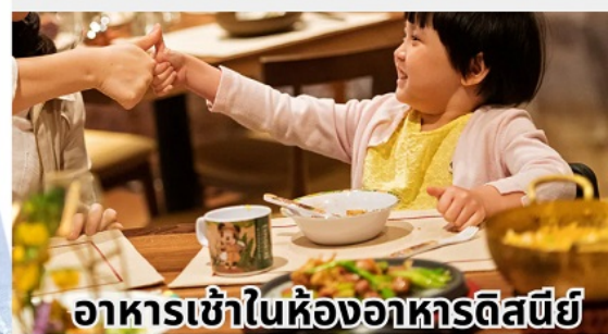
อาหารเช้าในห้องอาหารดิสนีย์