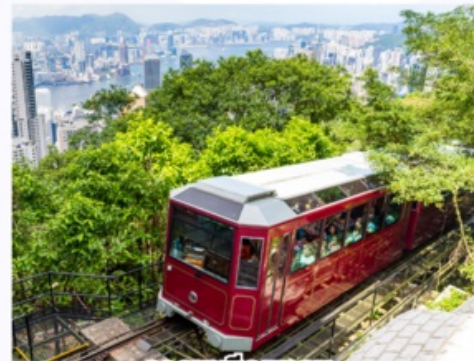
รถรางพิกแธม