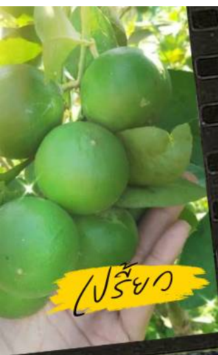
เขียว (น้ำขม)