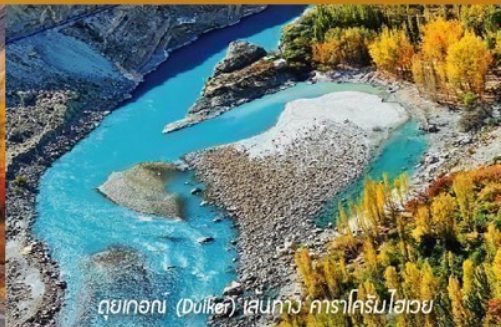
ดอยทอน (ดงโศก) เส้นทาง คาราโครัมไฮเวย์