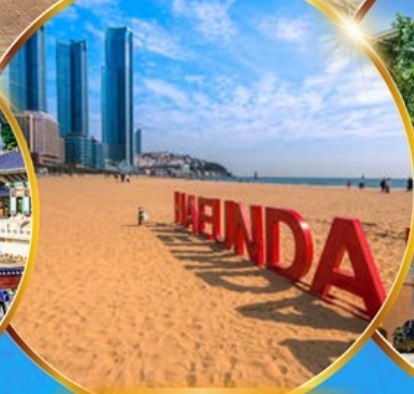
หาดแฮนแด