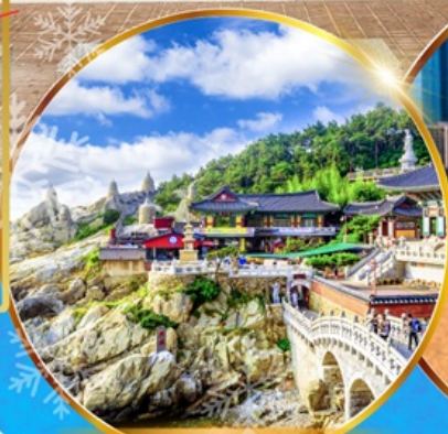
วัดแสงยงกุงซา