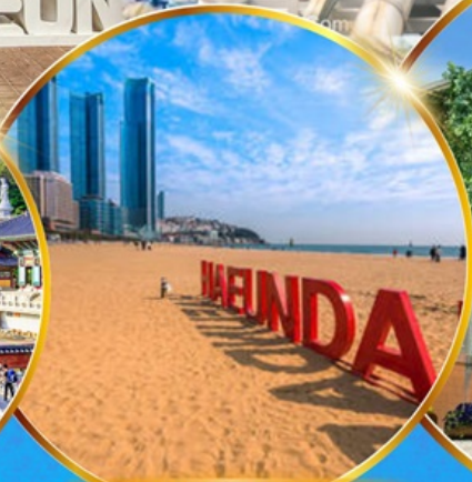
หาดแฮนแด