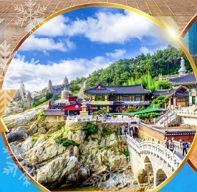
วัดแสดงยงกุงซา