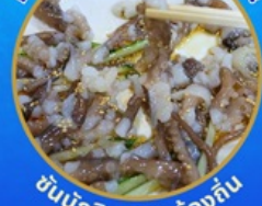
ชั้นนักกีฬา อาหารท้องถิ่น