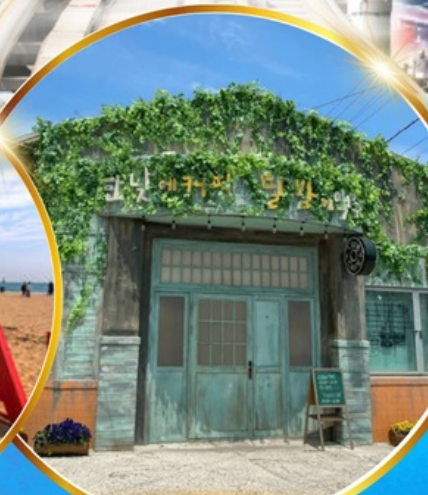
ตามรอยซีรีส์ดัง Hometown chachacha