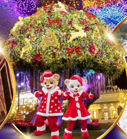
สวนสนุกเอเวอร์แลนด์ ฮิม พาร์ค