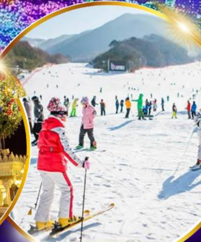
สนุกสุดมันส์ สกีรีสอร์ท

ชมจอ LED ขนาดยักษ์ที่รีสอร์ท 5 ดาว ใหญ่ที่สุดในเอเชียเหนือ สัมพัสมะสกีรีสอร์ท สนุกสุดมันส์ สวนสนุกเอเวอร์แลนด์ ชมพระราชวังคยองบกกุง ย้อนอดีตหมู่บ้านบุคซอน อันอก อิสระช้อปปิ้งคังนัม Lotte Duty Free