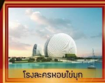
โรงละครหอยไข่มุก