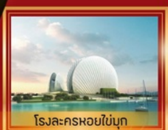
โรงละครหอยไข่มุก