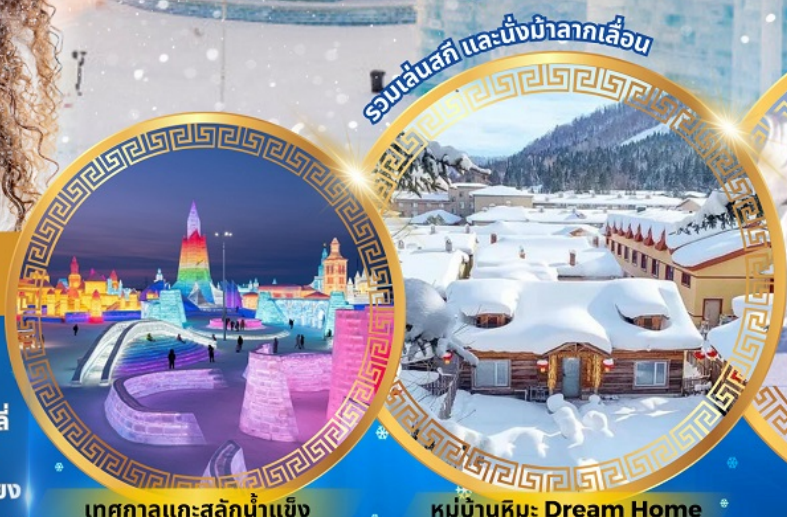
เทศกาลแกะสลักน้ำแข็ง

จตุรัสโบสถ์เซินโซเฟีย ถนนจงหยาง หมู่บ้านหิมะดินแดนมหัศจรรย์ อนุสาวรีย์ฝั่งหง สนุกสนานกับลานสกียาปูลี่ ถนนแฉ่ยู่เจีย เขาแกะหญา เขาป่าจูลู ภาพเขียน Ice and Snow แม่น้ำซงฮัวเจียง โซ่วว้ายน้ำแข็ง เกาะพระอาทิตย์