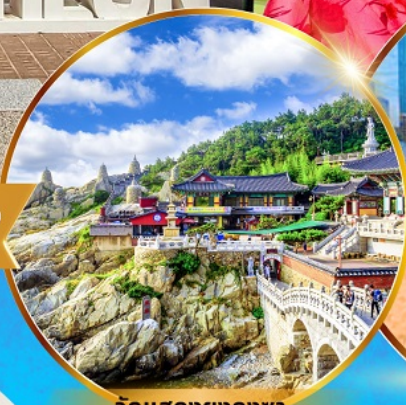
วัดแสดงยงกุงซา