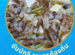
ชั้นนักชี อาหารท้องถิ่น