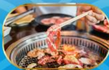
บุฟเฟ่ต์ ยากินิกุ