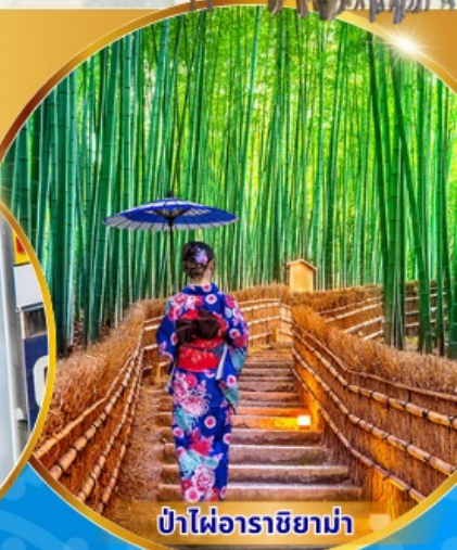
ป่าไฟอาราชิยาม่า

พักโรงแรม 3ดาว เที่ยวโตเกียว 1คืน โอซาก้า 2คืน ฟรี ประกันอุบัติเหตุ บริการ อาหารท้องถิ่น