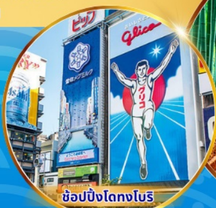
ช้อปปิ้งโดทงโบริ