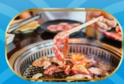
บุฟเฟ่ต์ ยากิniku

เดินทาง กรกฎาคม-กันยายน 67 สายการบิน PEACH AIRLINES (MM) peach นน.กระเป๋า 20 กก.