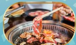
บุฟเฟ่ต์ปิ้งย่าง ไม่อั้น