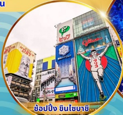
ช้อปปิ้ง ซินโซบาชิ