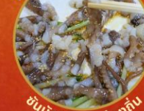
ซันนิกอิ อาหารท้องถิ่น