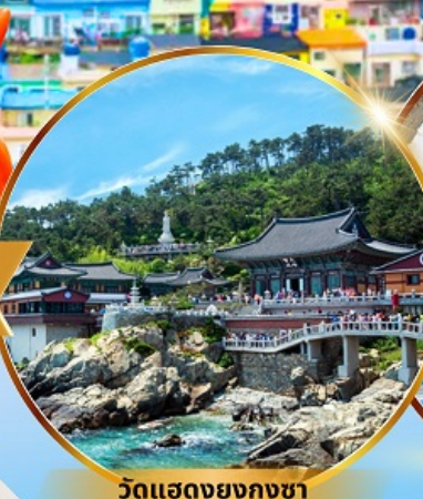
วัดแสดงยงกุงซา