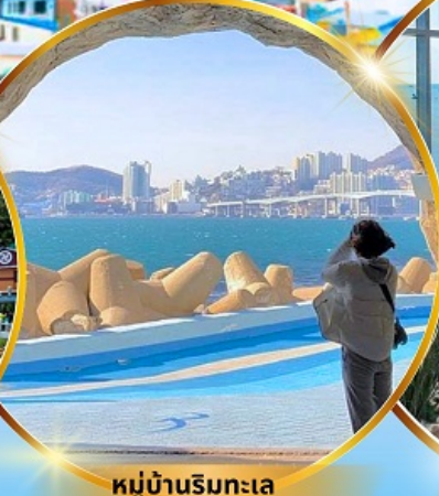
หมู่บ้านริมทะเล