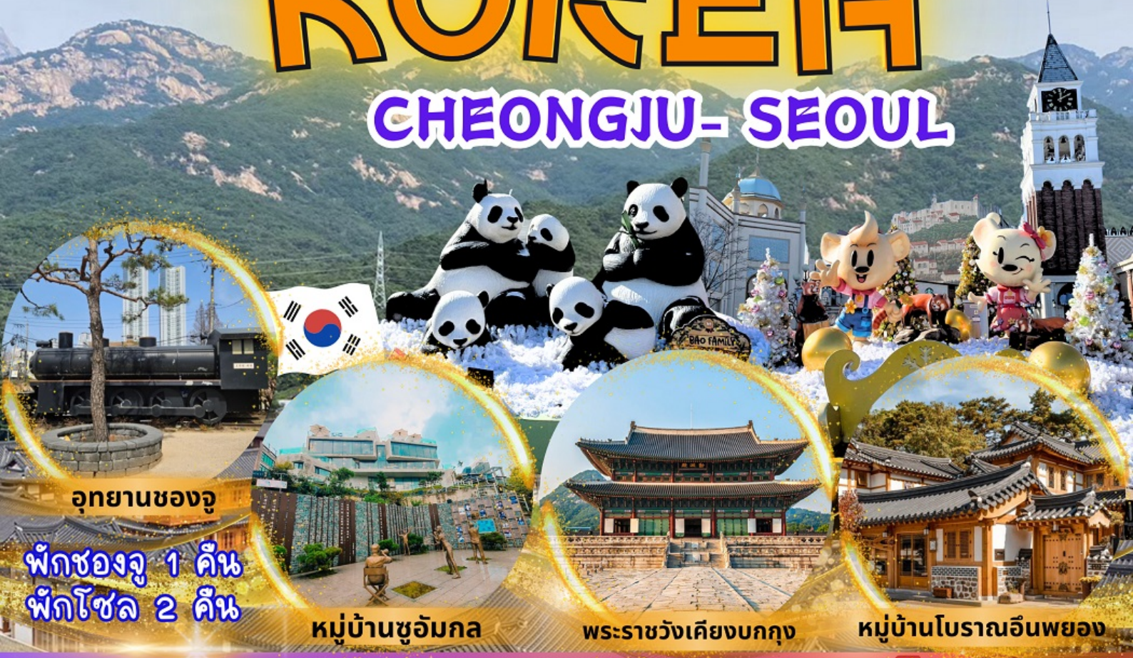
อุทยานซองจู